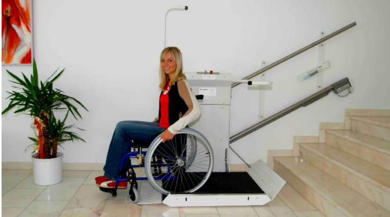
Un plataforma elegante y moderna

Un diseño robusto y estable garantiza un acceso seguro en las paradas