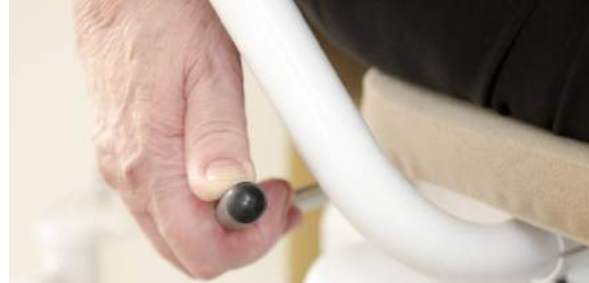
Maneta para girar el asiento en las paradas