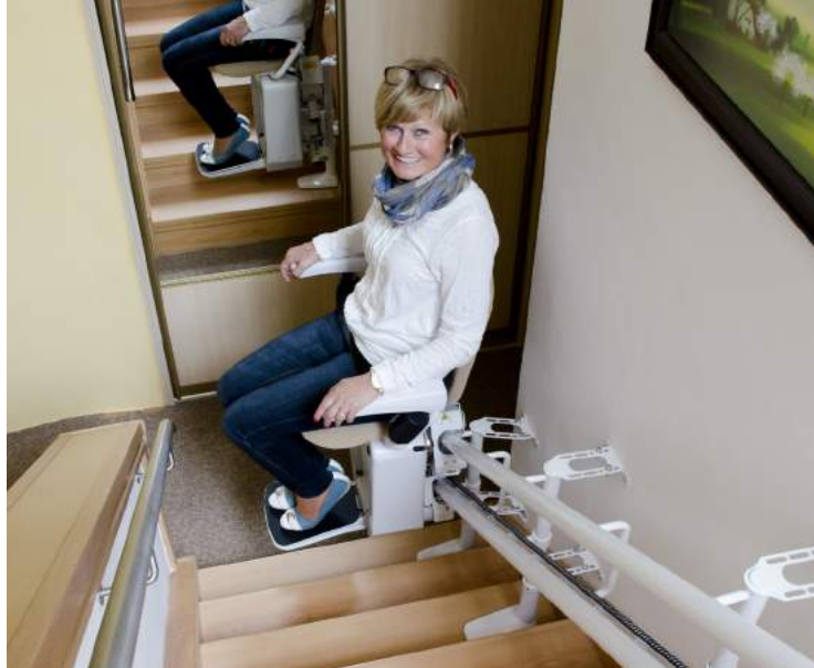
Fijación especial al muro para evitar la perforación de los pasos