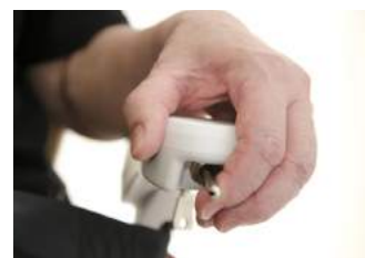
Posición cómoda del joystick para un control fácil de la salvaescalera